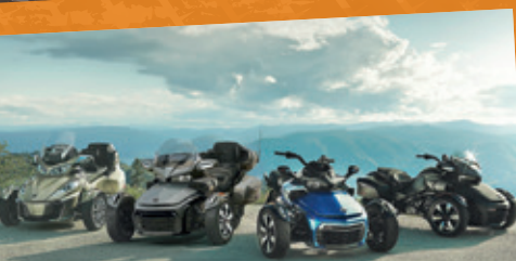
CAN-AM SPYDER NIEUW IN DE SHOWROOM