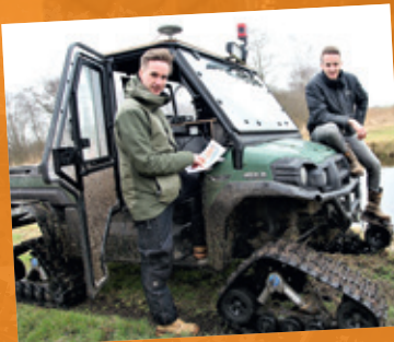
LANDMETEN IN EEN SIDE BY SIDE MET TRACKS