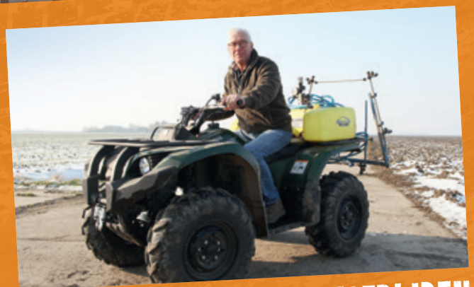
ONKRUID BESTRIJDEN MET DE YAMAHA GRIZZLY