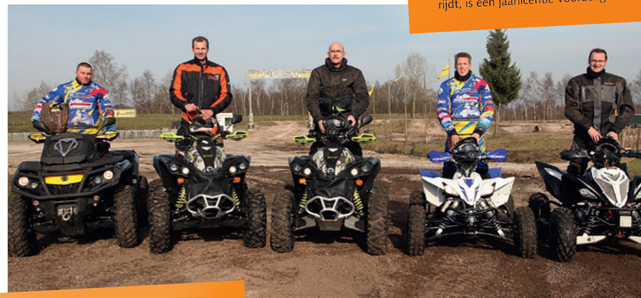
Klaar voor de start: samen off road rijden is leuker dan alleen!