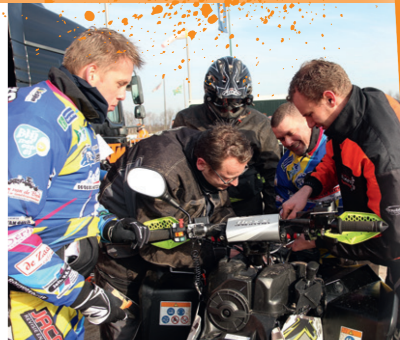
Samen aan de start nog even de laatste voorbereidingen treffen.