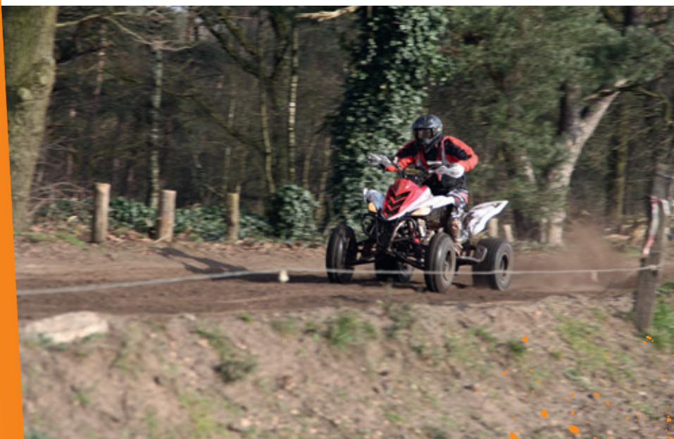
Gas erop in de omgeving van Eindhoven.

Deze ritten zijn in 2016. Kijk voor de complete, actuele kalender op www.enduro.nl/kalender.htm